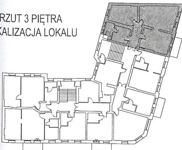
RZUT 3 PIĘTRA LOKALIZACJA LOKALU